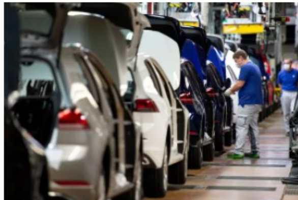
Linha de montagem da Volkswagen

Assim sendo, no intuito de cumprir com o determinado no Edital, a Localiza requer que seja excluída a exigência de veículos novos e que seja possibilitada a entrega de veículos seminovos, com até 2 anos de fabricação, atendendo a todas as especificações do edital.