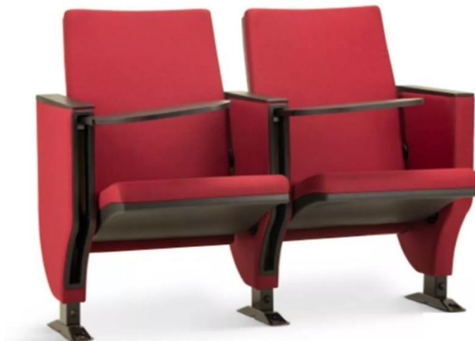
Figura meramente ilustrativa