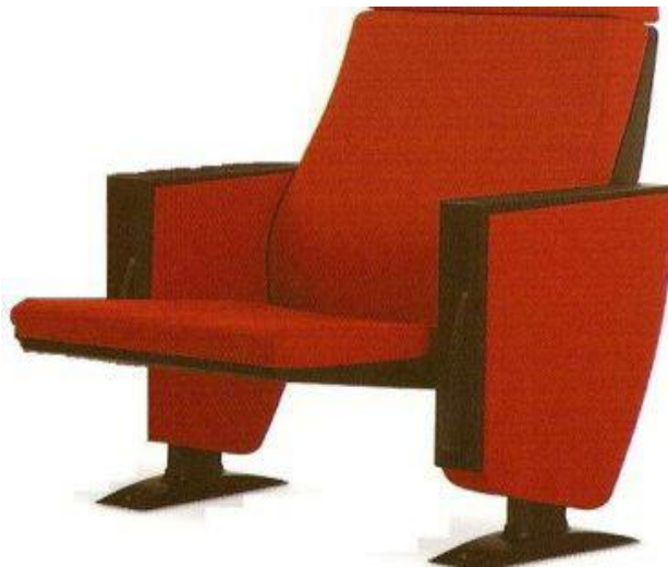
Figura meramente ilustrativa