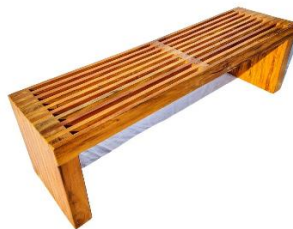
Figura meramente ilustrativa

Materiais Utilizados: Madeira Peroba Rosa